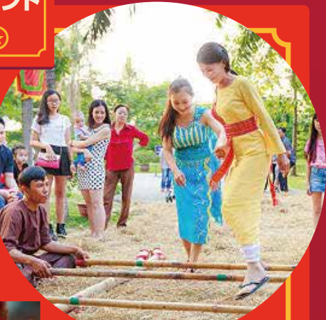
ニャイサップ(竹ダンス)

参加して 楽しめる! 旧正月の定番 参加 自由 参加した方には、 素敵なプレゼント があります。 ※数に限りがございます。 予めご了承ください。