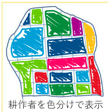
耕作者を色分けで表示