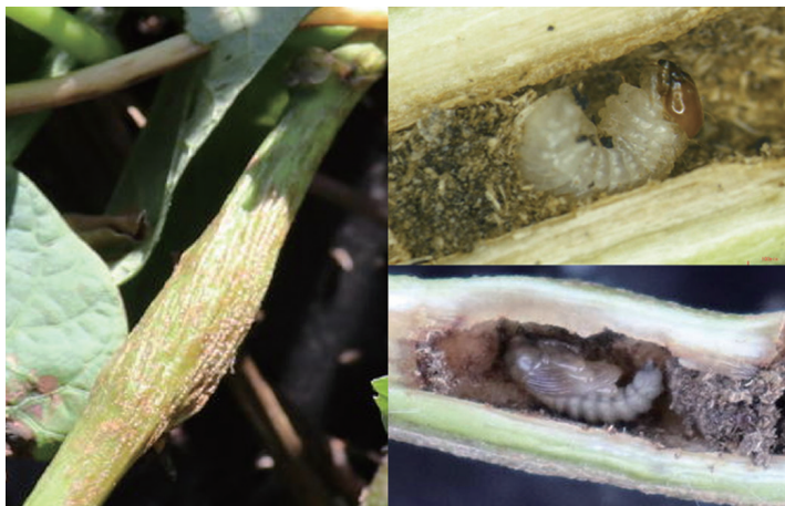
つるの膨れと内部の幼虫(上)とさなぎ(下)