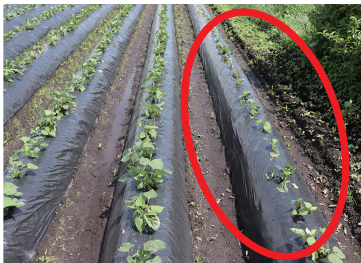
さつまいもほ場では周縁部ほど被害が多く認められる。