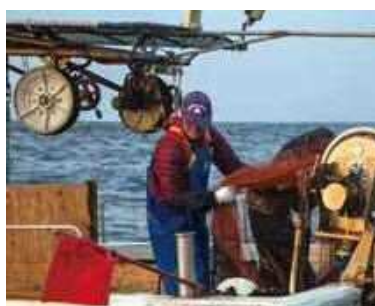
ごち網漁／江口漁港