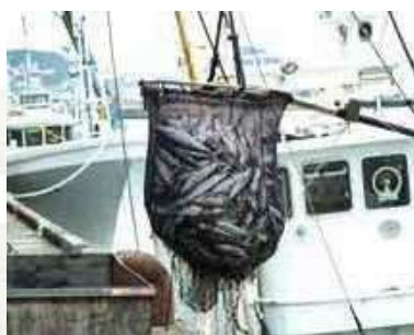
枕崎漁港の水揚げ風景