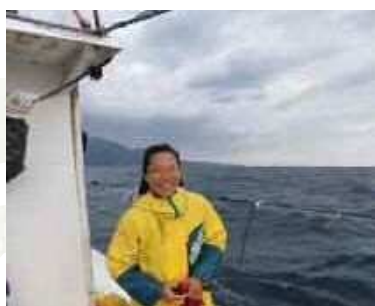
トビウオロープ曳／屋久島