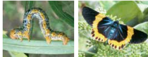
幼虫: 体長約5mm、オレンジ色、黒色(灰色)と黄色の模様をしたシャクトリムシ。 成虫: 開長約6mm、体長約2mm。全体的に濃紺で、羽には黄色の帯があります。

また、散布は、集落単位などまとまった駆除を行う方法が効果的です。ご自身で散布が難しい場合は、造園業者などへご相談ください。