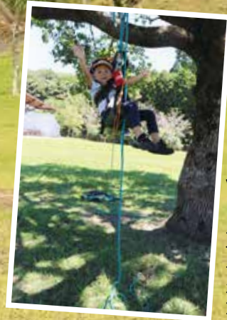
ツリークライミング

申込方法 メール・ファックス・郵送のいずれか アドレス kaiden.mura.info@gmail.com ファックス 099-471-4345 郵送 〒899-7402 志布志市有明町野井倉 1489-1 申込締切 7月27日(火) 必着 選考方法 抽選(当選者へは7月末ごろに連絡)