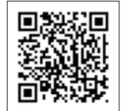
鹿児島県特設サイト