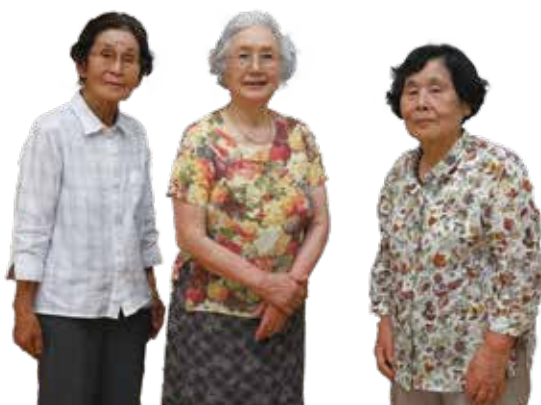
志布志淑女会の皆さん

【志布志淑女会】会員それぞれの戦争体験を後世（若い世代）に残したいとの思いで、平成26年に結成。市内の小・中学校での平和学習など、地域の語り部として活動されています。