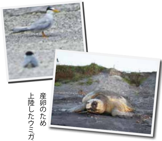
通山海岸のコアシサシ

通山校区は、志布志湾に面しており、南海トラフ地震による津波への対策や自治会加入者の減少による地域活動への影響が重要な課題となっています。また、海岸線や海岸松林の環境整備と共にウミガメやコアシサシなど絶滅危惧種の保護も懸念されています。