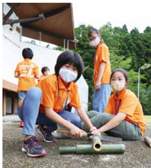
写真は、6月26日にJACOクラブの皆さんが研修として体験した水てっぽう作りの様子です。太い竹を切るが大変で、友だちに押さえてもらいながら、作業を進めていました。