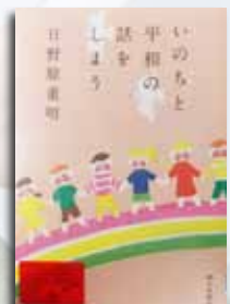
朝日新聞出版社 1,200円＋税

◆ 「いのちと平和の話しよう」 日野原重明／著 いのちとは、あなたの持ち時間です。どう、自分らしく使いますか？ 『朝日新聞』土曜別刷り「be」連載から「いのち」「平和」がテーマのインタビュー37編を選び、収録する。