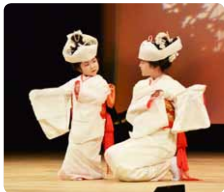
立派に舞踊を披露してくれました