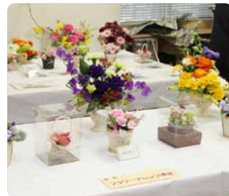
学びの成果を発表しました