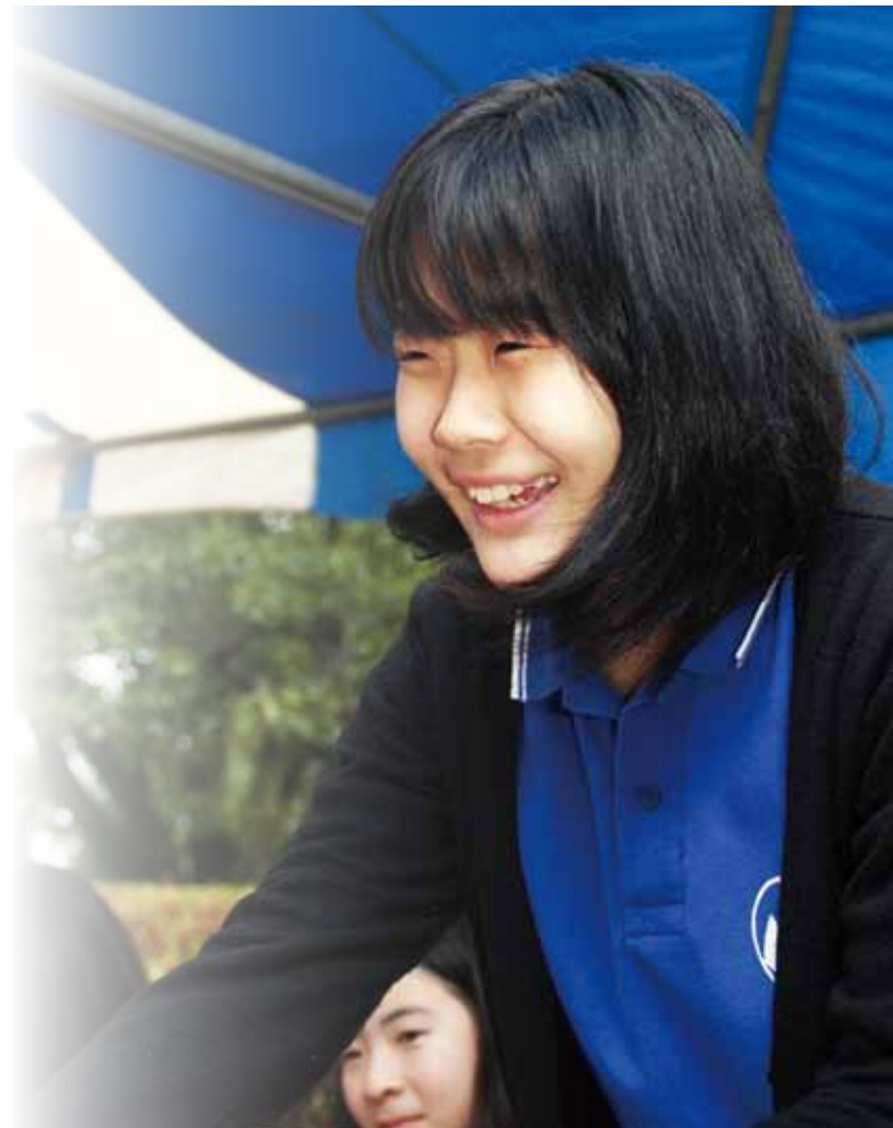
■問い合わせ先：教育委員会 生涯学習課 社会教育係 Tel：472-1111 (内線335・336)

まずは、子ども会活動や地域活動等に参加するなどして、周囲の子どもたちと共に成長を促す方法、もう1つは、教育委員会などが主催するリーダー研修会や青少年研修事業に参加したり、ジュニアリーダークラブやインリーダークラブに入るなどして、リーダーとしての資質を身につけさせる方法です。