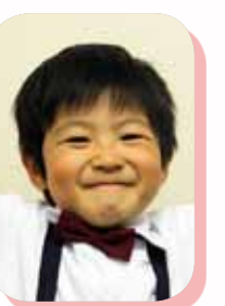
こうせい 混生 ちゃん