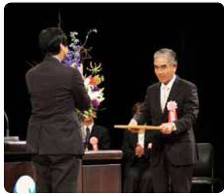
多くの表彰が行われました