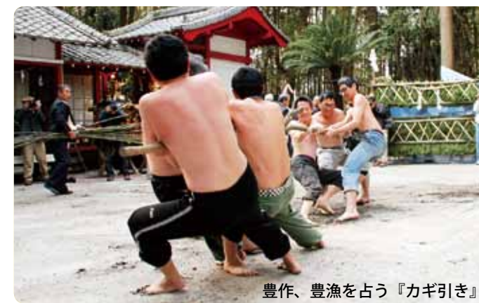
豊作、豊漁を占う『カギ引き』