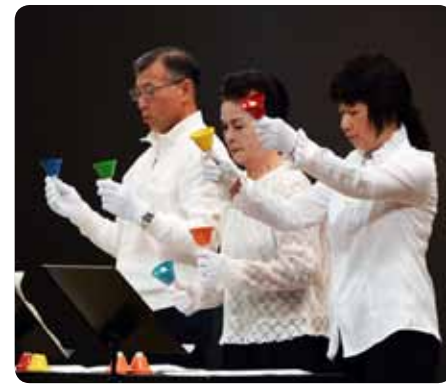
美しい音色が響いた「ミュージックベル」