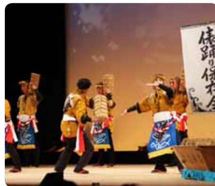
伝統を後世に伝える「俵踊り」