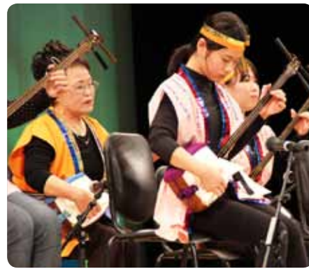
見事な腕前の子ども三味線