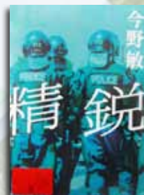
朝日新聞出版社 1,600円＋税

◆ 「いのちと平和の話しよう」 日野原重明／著 いのちとは、あなたの持ち時間です。どう、自分らしく使いますか？ 『朝日新聞』土曜別刷り「be」連載から「いのち」「平和」がテーマのインタビュー37編を選び、収録する。