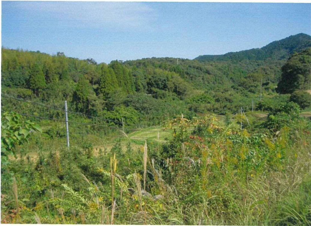
志布志市志布志町帖大字前田8809-3外1筆現況