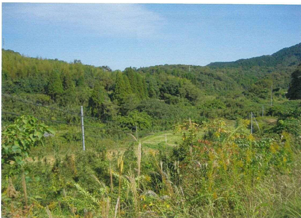
志布志市志布志町帖大字前田8824-1外1字外43筆現況