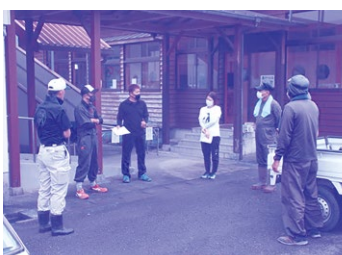
作業前の打ち合わせ

本市は、地域とともにある学校づくりと学校を核とした地域づくりの実現を目指しており、学校と地域の連携・協働が不可欠である。今後全ての公民館が移行を進めている地域コミュニティ協議会を核として、学校運営協議会を活かし、地域学校協働活動が一層充実するよう、協働活動の在り方や財政面の措置も含めた方策について、所管する企画政策課、学校教育課、生涯学習課が連携し進めていきたい。