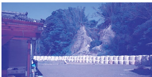
復旧の進まない被災箇所

市長 申請される方は、不安がより一層募るので、あいまいな回答ではなく要望される方については、調査結果の内容を付して文書で回答するようにしたい。