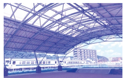
屋根が整備された多目的イベント広場