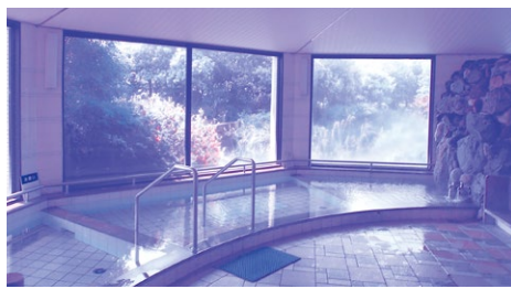
健康ふれあいプラザ入浴施設

利用できる者の範囲は、高齢者、小学生以下の者、身体に障がいがある者及びその介護者となっている。利用料は、小学生以下の者は50円、それ以外の者は200円と条例で定めている。