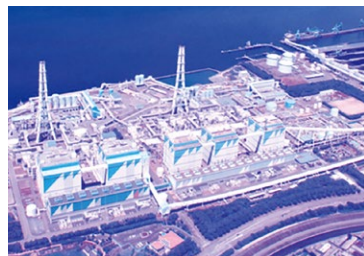
アンモニア混燃実証事業を行う碧南火力発電所

臨海工業団地5・6工区に、新たな産業育成のため、政府の政策に沿った水素やアンモニア精製プラント企業を誘致し、先進的な再生資源の街として、率先して取り組むべきではないか。