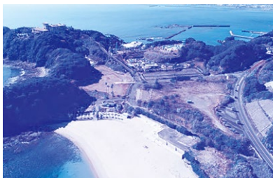
早急な観光施設整備を

市長 第2次市観光振興計画に、しっかりと盛り込み、魅力ある観光事業の整備に早急に取り組む。