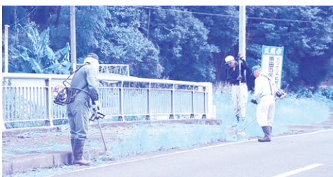
委員による通学路伐採