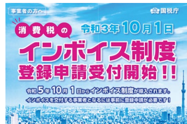
インボイス制度登録申請のチラシ(国税庁)