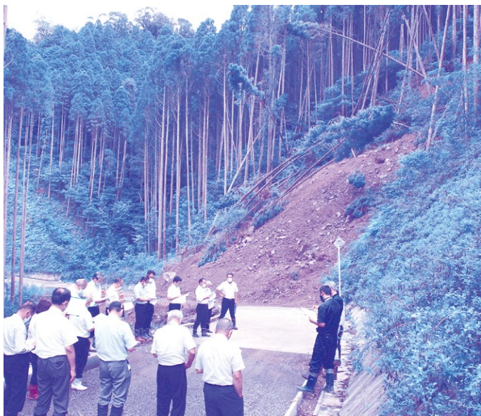
8月豪雨で被災した林道-御在所岳線-

A 今回決壊した箇所以外では、今後同規模の復旧が必要となるころはないと考えている。また、林道のコンクリート舗装については、急な勾配の箇所を対象に施工されている。令和7年度に事業完了の計画であるが、完了した後に、県の事業なども要望・活用し、舗装化に向けた事業展開を模索したい。