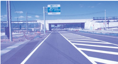
志布志有明ICの安全対策を

② 速度制限については、速度基準により50kmの規制であり、速度注意看板の設置を検討する。 ③ 市道の4車線化については、年末に完成する予定で、その後、カラー舗装を行う。 ④ 「通学路あり」の予告板は、ガードレール