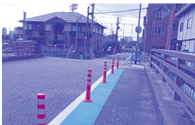
急がれる通学路安全対策

教育長 市内通学路における危険箇所等の改善要望は、学校から73ヶ所報告があった。