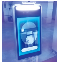
市役所に設置してある自動体温計

問 2学期は1年の中で一番行事が多い学期であり来校者も格段に増えてくる。そこで水際対策として、子どもたちや来校者の体温をスムーズに測定できるように各学校に自動体温計を設置できないか。