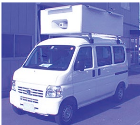
4年後には公費で負担か

事務局長 県内でも多くの自治体が導入している状況もあるので、4年後の市長選・市議選までには導入に向けた結論を出すことになっている。