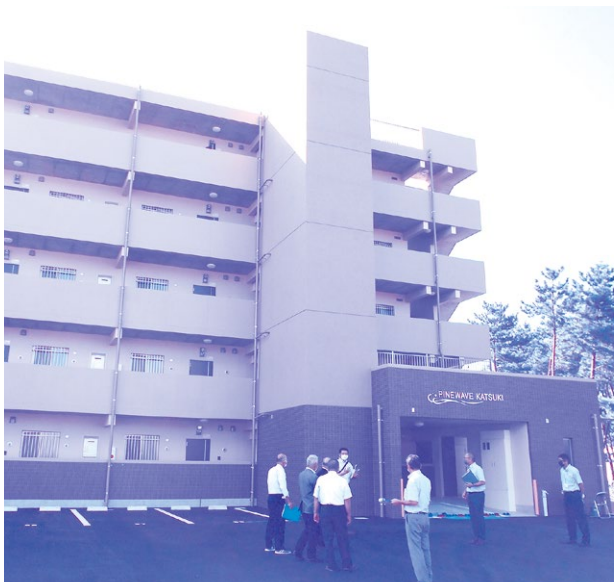
地域優良賃貸住宅（パインウェーブ香月）の現地調査

A 本契約については、 条例の整備を行った ことにより、契約の目的 の（仮称）部分を削除す ることとしたものである。