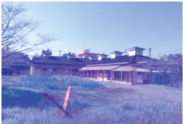
閉園が決まった山重幼稚園

A 現在、7ヶ所の学童や放課後児童クラブに通っている状況である。昨年度実施したアンケートでは、「山重幼稚園のあとに学童保育ができた場合、利用したいか」との問いに、30人程度が行きたいとの意向を示した。