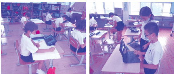
タブレット端末を使用した学習

A タブレット端末のパスワードやIDアカウントについては、児童・生徒が個人で管理するように割り当てられている。また、学校・担任教師も、管理している状況である。