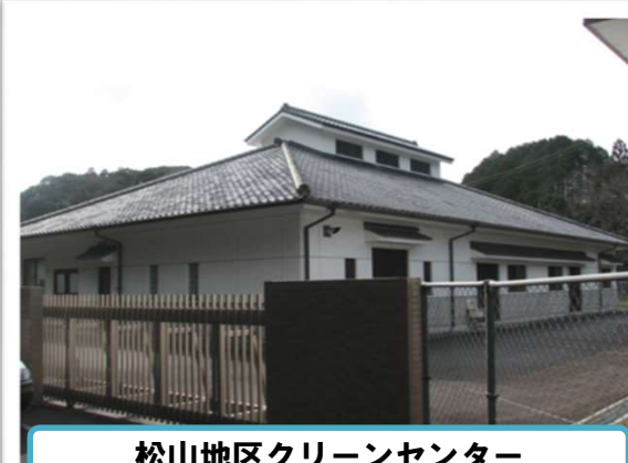
松山地区クリーンセンター