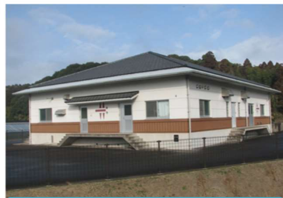
蓬原地区浄化センター