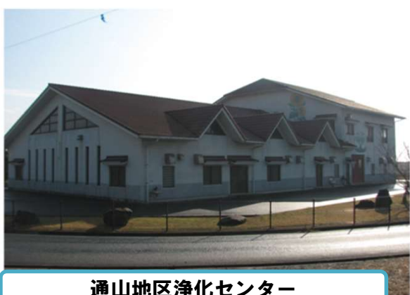
通山地区浄化センター