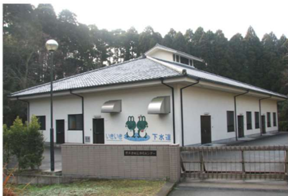
野井倉地区浄化センター