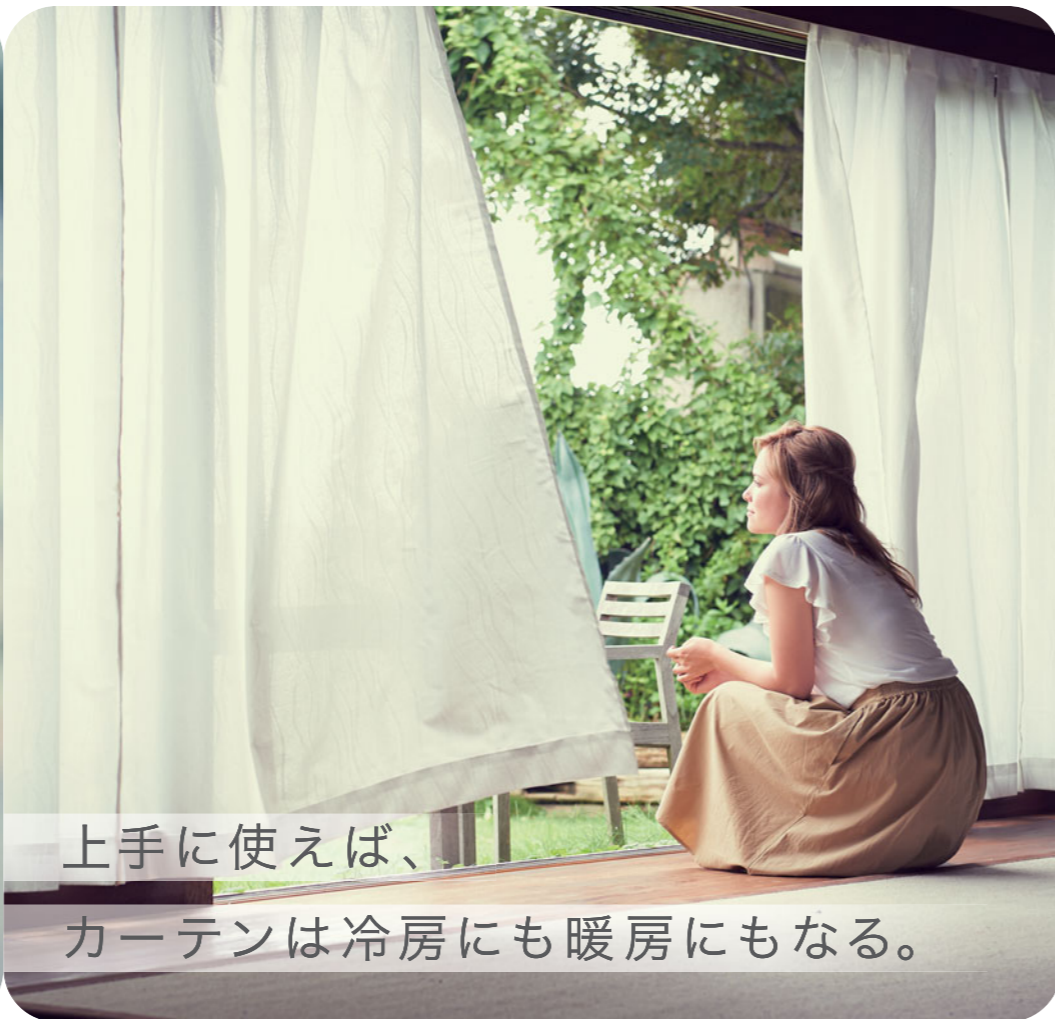
上手に使えば、 カーテンは冷房にも暖房にもなる。