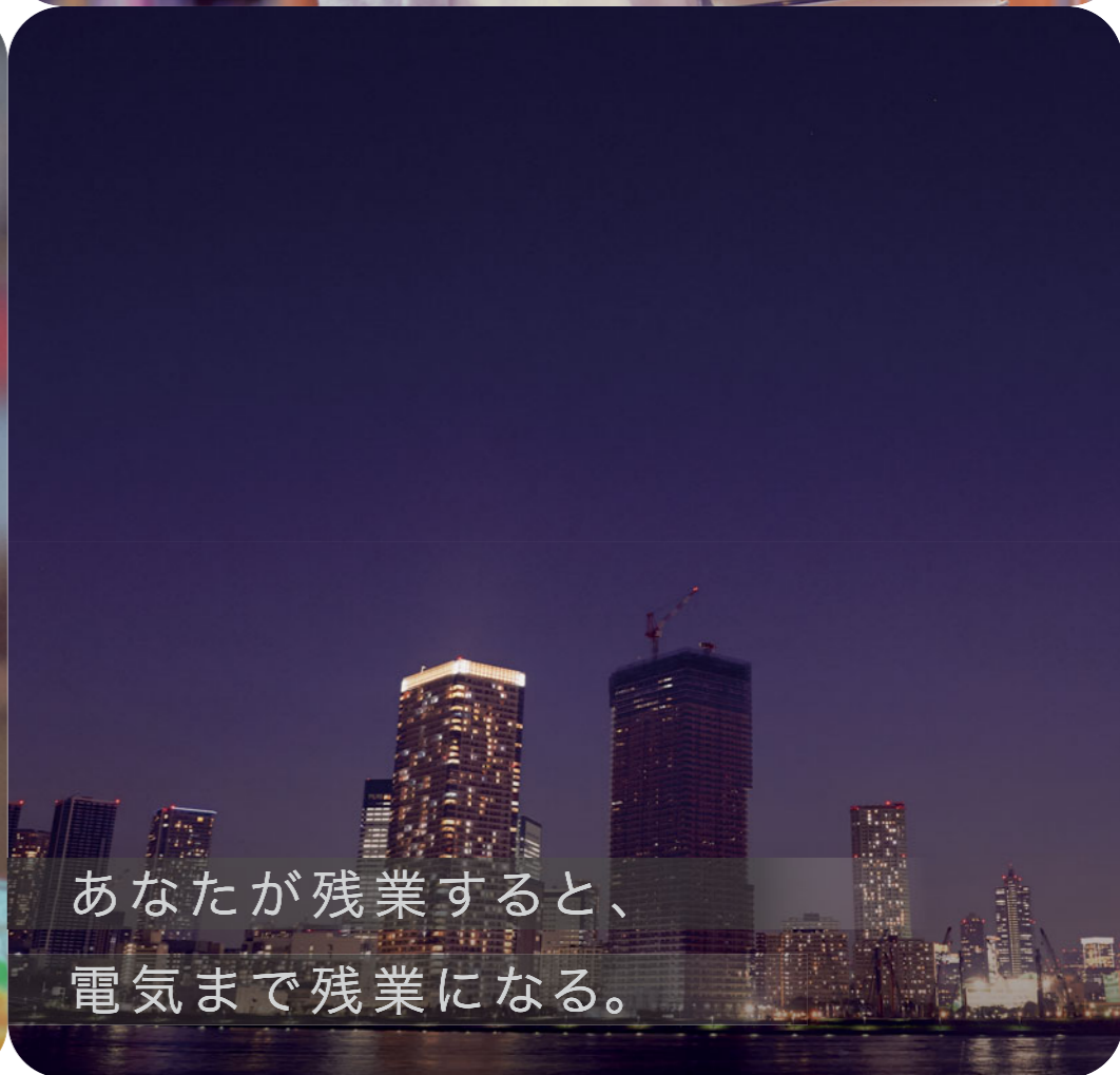
あなたが残業すると、 電気まで残業になる。