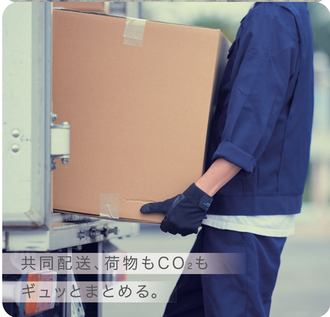
共同配送、荷物もCO 2 も ギュッとまとめる。