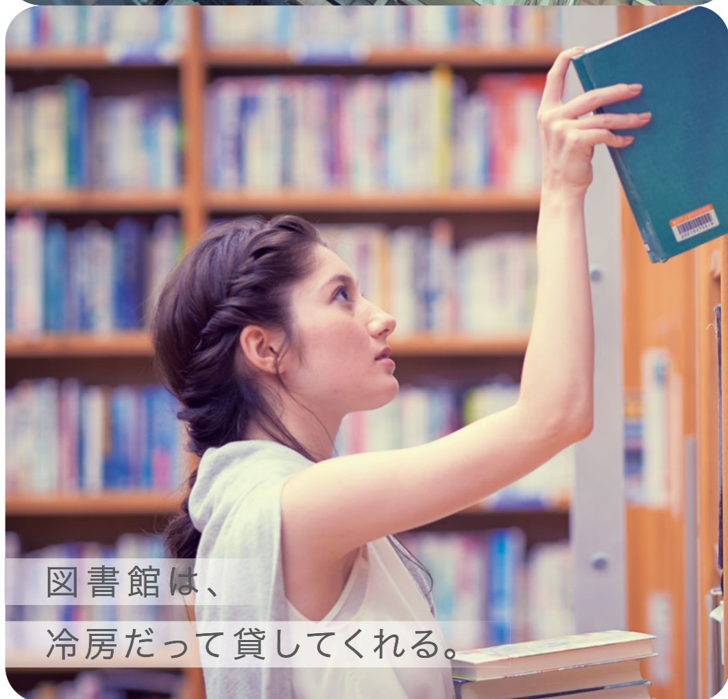
図書館は、 冷房だって貸してくれる。