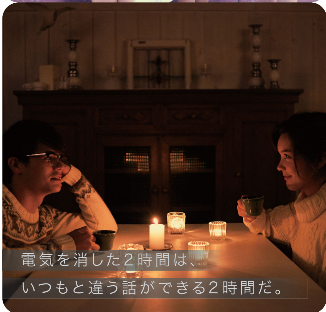
電気を消した2時間は、 いつもと違う話ができる2時間だ。