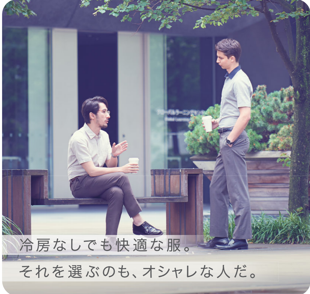
冷房なしでも快適な服。 それを選ぶのも、オシャレな人だ。