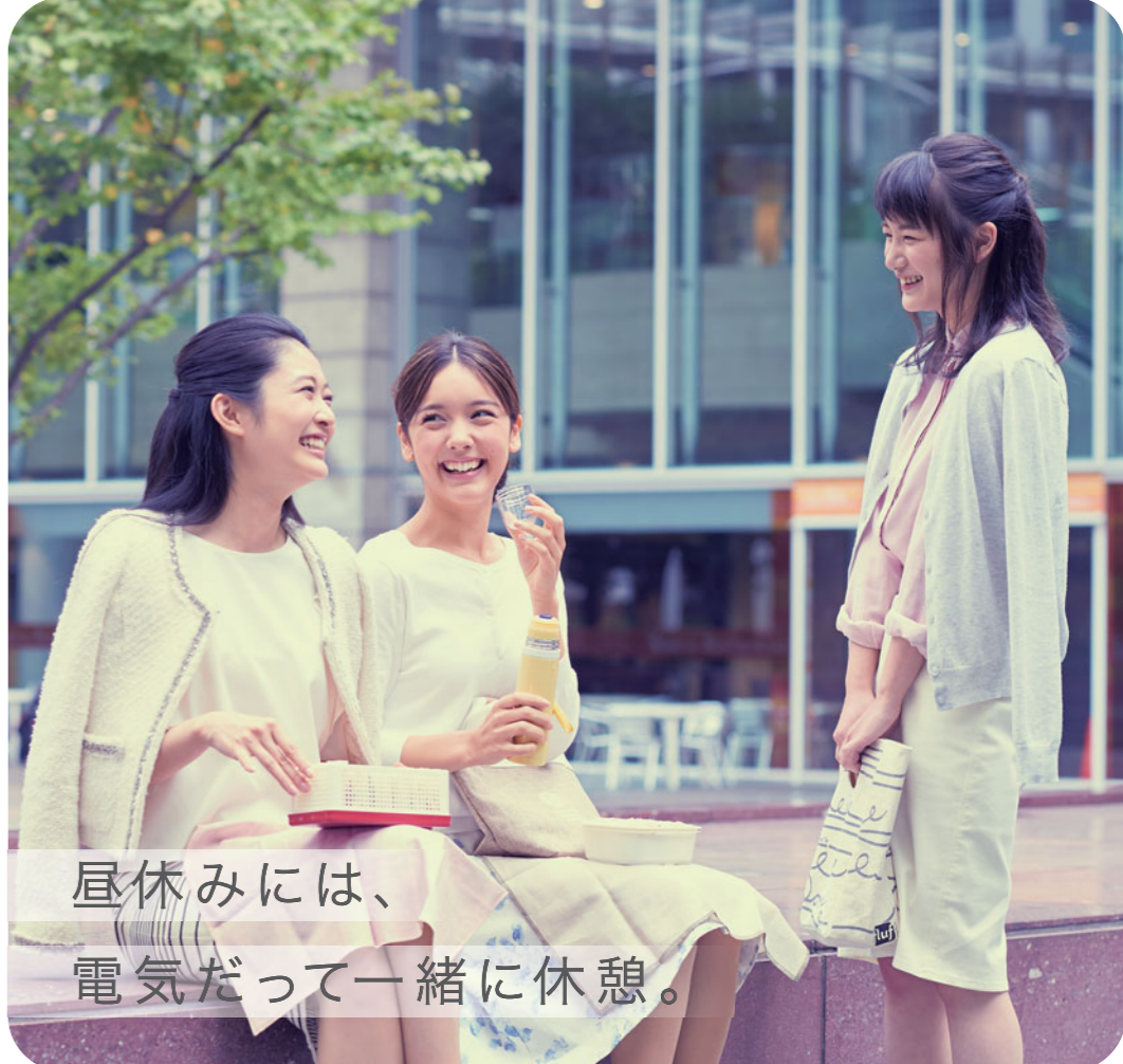
昼休みには、 電気だって一緒に休憩。