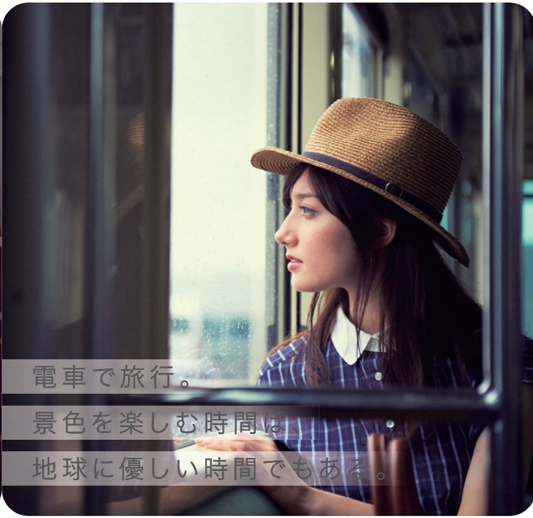
電車で旅行。 景色を楽しむ時間は、 地球に優しい時間でもある。