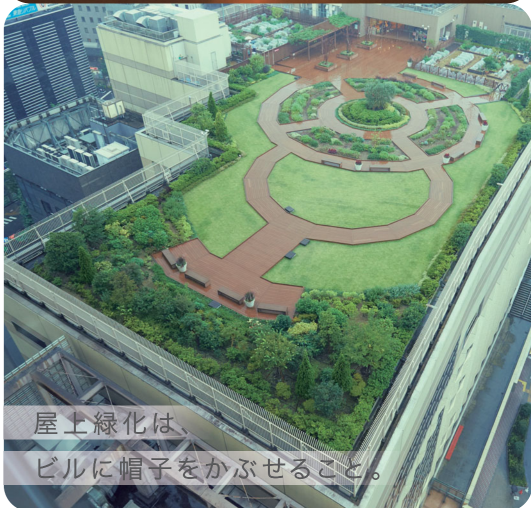
屋上緑化は、 ビルに帽子をかぶせること。