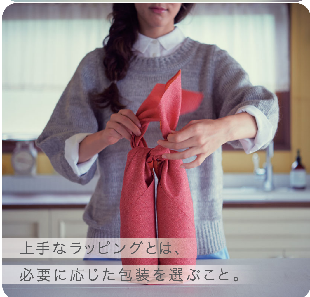
上手なラッピングとは、 必要に応じた包装を選ぶこと。