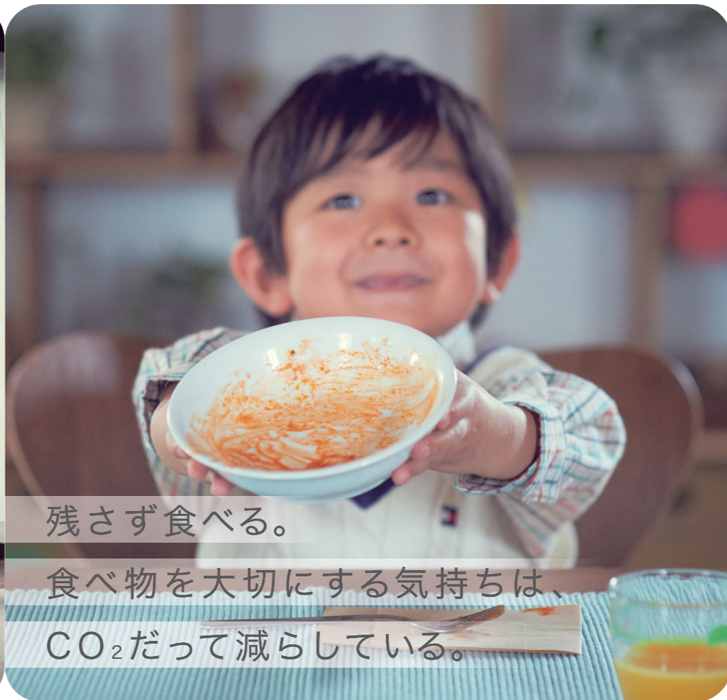
残さず食べる。 食べ物を大切にする気持ちは、 CO 2 だって減らしている。