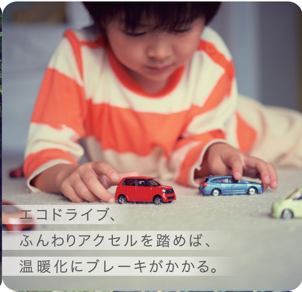
エコドライブ、 ふんわりアクセルを踏めば、 温暖化にブレーキがかかる。