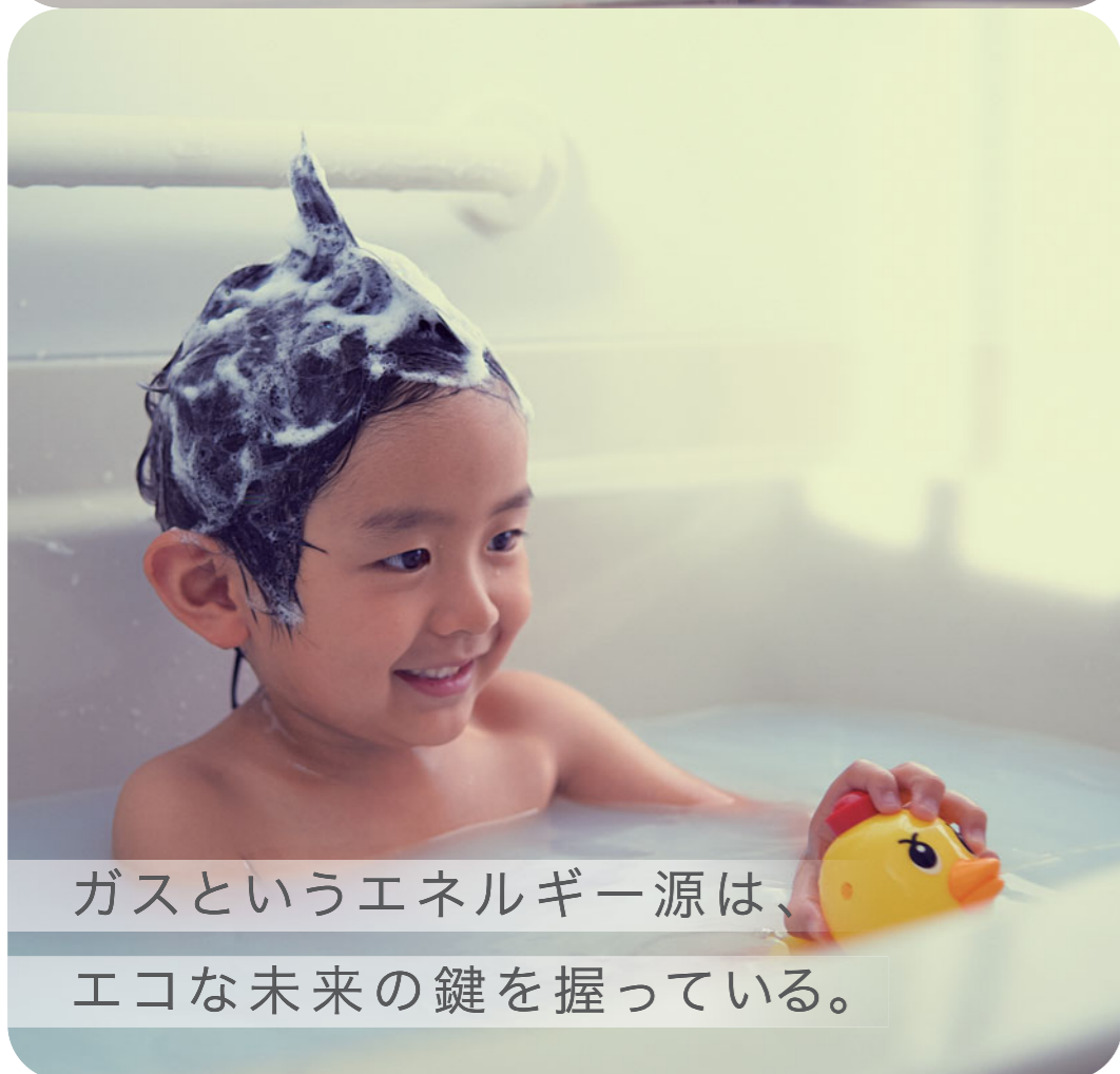
ガスというエネルギー源は、 エコな未来の鍵を握っている。