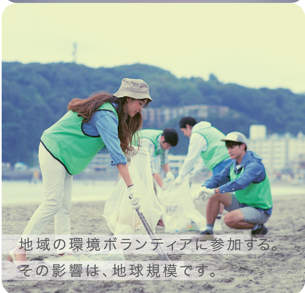
地域の環境ボランティアに参加する。 その影響は、地球規模です。