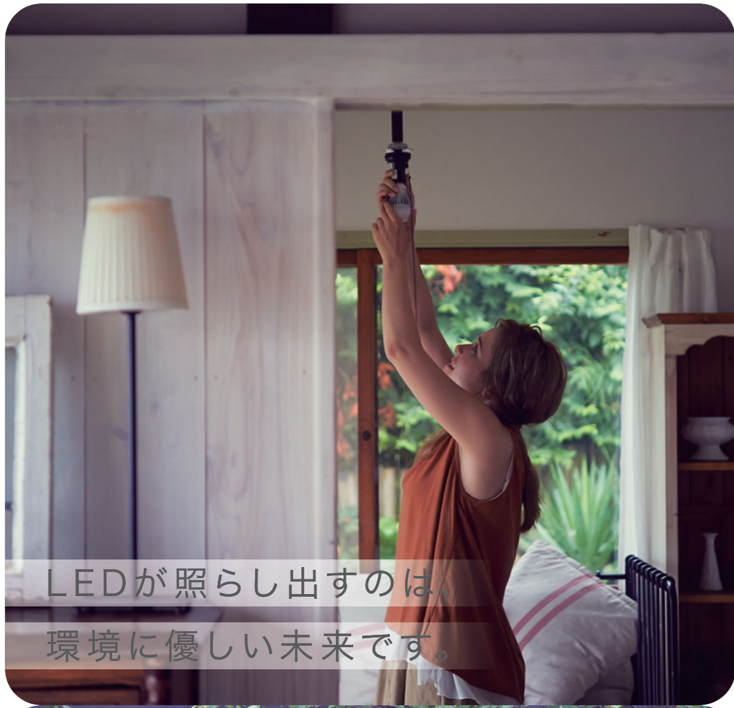
LEDが照らし出すのは、 環境に優しい未来です。