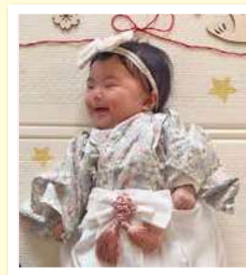
ちかこ 千怜ちゃん(5ヶ月) 志布志町 帖