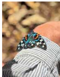
▲日本一美しい蛾 サツマニシキ

地域支援員として8カ月が経ち、各協議会の皆さんとの交流を通して、改めて地域の魅力を感じています。関わっていく中で、地域の皆さんがいきいきと活動し、地域力が高まっていくよう、これからも伴走支援を続けていきたいと思っています。つながりを大切に、地域の声に耳を傾けながら、一歩ずつ信頼を築いていけたらと思います。