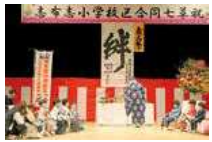
▲志布志小学校区合同七草祝

地域支援員および集落支援員は、地域の皆さまと伴走しながら、両者の橋渡しをこれからも続けます。