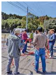
▲原田校区コミュニティ協議会 防災の細結び講座の様子