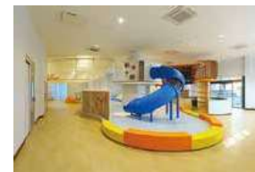
▲1階 うみのエリア (小学生の遊び場) こども1人1時間 200円