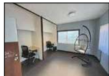
▲2階レンタルオフィス

市移住・交流支援センター「Esplanade(エスプラネード)」では、施設2階にレンタルオフィスを整備し、創業や事業展開を支える場としての活用を進めています。地域内外の事業者が新たな拠点として利用できる環境を整え、ビジネスを通じた交流や関係人口の拡大につなげています。このレンタルオフィスは、自主事業として創業支援の場となるよう整備したもので、Wi-Fiや空調、電源を完備した多用途なスペースです。これまでイベントでの展示利用やカウンセリングなど、さまざまな用途で活用されてきました。