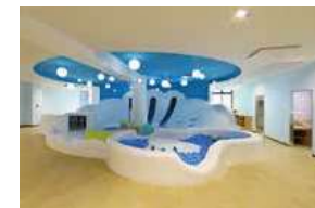
▲2階 くものエリア (小学生未満の遊び場) こども1人1時間 200円 さとやまエリア (0～1歳の遊び場) 0～1歳のこどもは無料