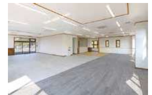
▲3～4階 コワーキングスペース フィットネスジム eスポーツ センサリールーム