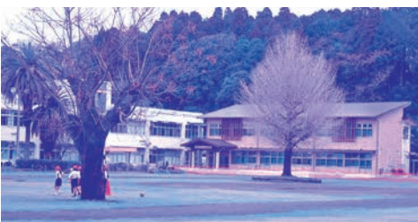
伊崎田中学校 新校舎

市長 特別支援学校の整備により環境が充実し、地域の活性化が期待できると認識しているが、現在、整備については考えていない。