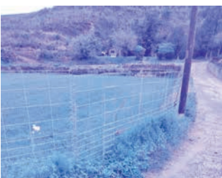
設置が進むワイヤーメッシュ柵

令和7年度には、物価高騰に伴う捕獲実施者の経費負担を減らすため、イノシシの捕獲奨励金を増額した。また、令和2年度から国の事業を活用し、ワイヤーメッシュ柵を要望のあった地域が設置している。