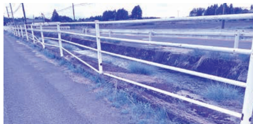
有明中学校前 ガードパイプ落下箇所

定期的な現地確認や調査を行い、損傷程度や優先度を勘案して、順次修繕を進めていきたい。