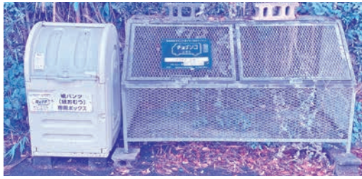
チョイソコしぶし停留所

なお、設置に当たっては、現地確認を行って、実情に応じた停留所の設置ができるように努めていきたいと考えている。