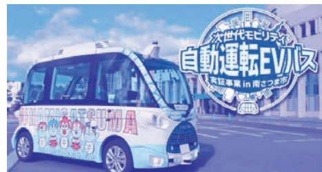
南さつま市で試験中の自動運転バス

市長 大変関心があり、実証実験や研修会などに参加し、調査研究をしている。国の事業もあり、将来的に、例えば市街地などを自動運転で循環するバスを導入し、その停留所への移動手段としてチャイコシコしぎしを活用するなど、利便性を高める取り組みが必要だと考えており、検討していく。