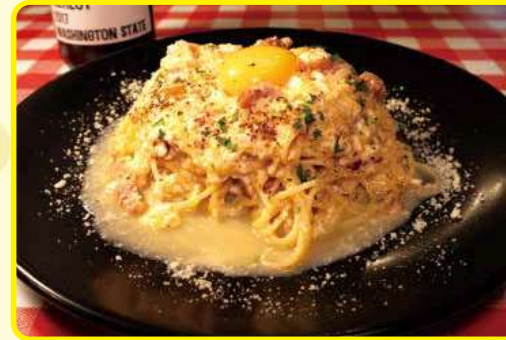
(1カ月ごとに替わる限定メニューです)

「ぺぺたま。」は福岡の名店が発祥。その味に感激し、再現すべく3年もの試行錯誤を重ねて、本物と遜色ない逸品に仕上がりました。ニンニクがきいたソースに和出汁と卵が合わさり、ピリリと辛いのにクリーミー。そのクセになる味わいにリピーターが続出中!ぜひ一度ご賞味ください。