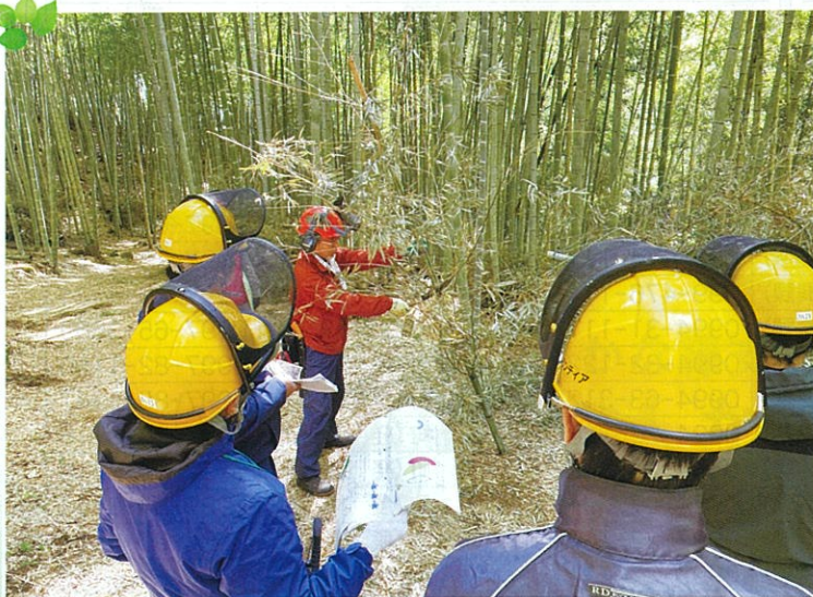
竹林整備の安全作業教育

緑の少年団や森林ボランティアの活動を支援し、森林づくりの担い手を育成しています。