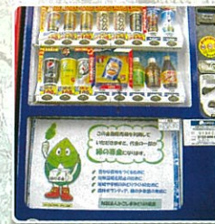
緑の募金対応の自動販売機