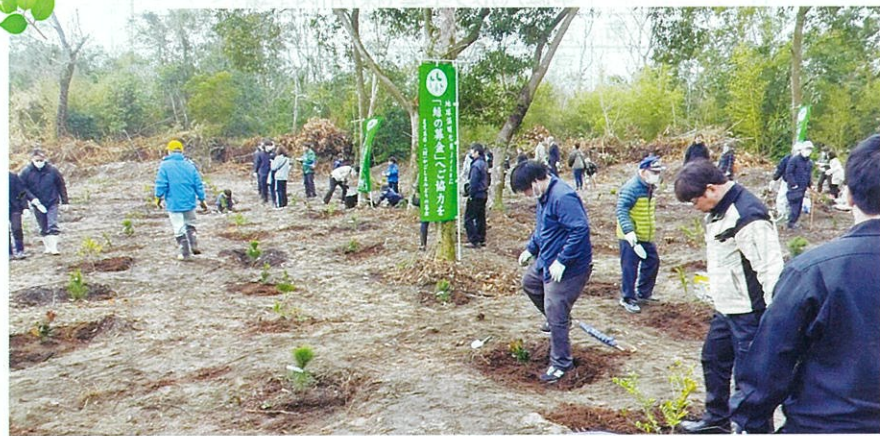
地域住民参加の地区植樹祭（大隅）