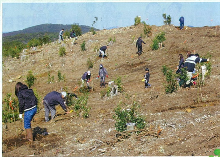
企業の森づくり活動（南九州市）