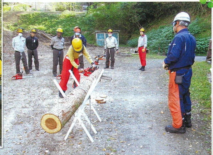
チェーンソーの安全講習