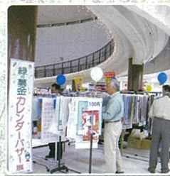
カレンダーバザー