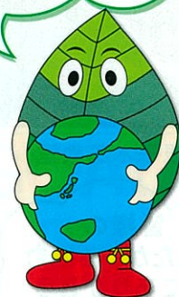
イメージキャラクター グリーン先輩

みんなで守り 育てよう、 山の命、森の恵み。 緑あふれる豊かな 地球を次世代に 引き継ぐために。