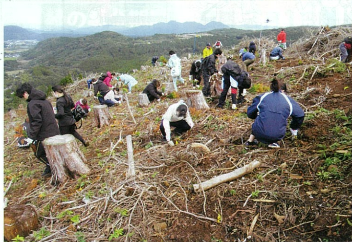
九州森林の日植樹祭

持続可能な森づくりを目指し、企業・団体、一般県民など多様な主体による県民参加の森林づくり活動を支援しています。