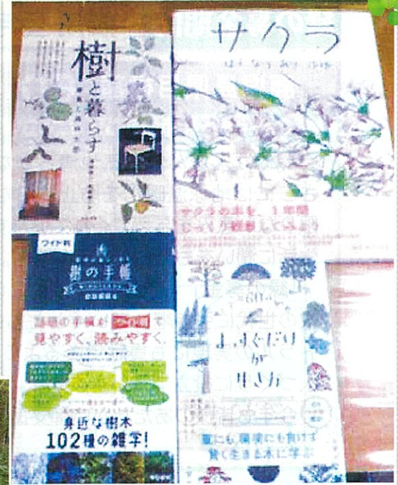
緑化に関わる文庫の贈呈