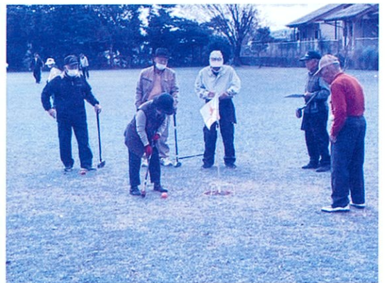
(志布志・松山地区大会の様子)