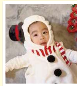
あつ 眺ちゃん(7カ月) 志布志町帖