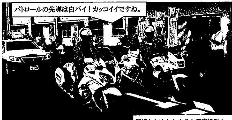
パトロールの先導は白バイ！カッコイイですね。