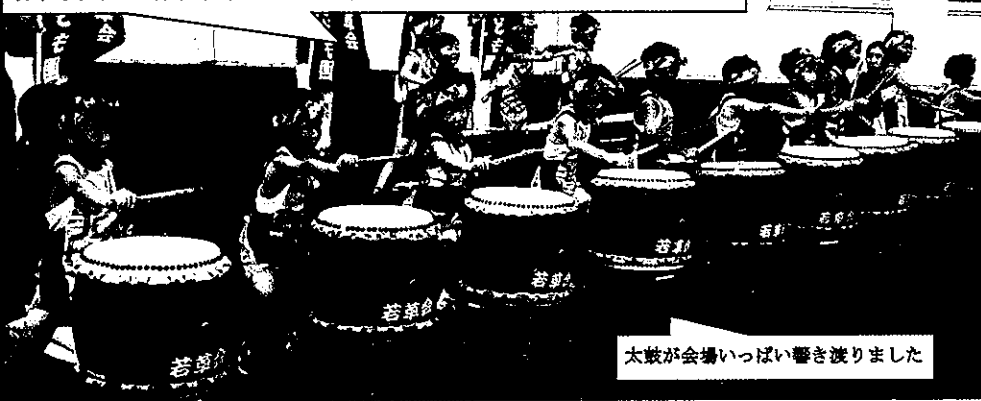
太鼓が会場いっぱい響き渡りました