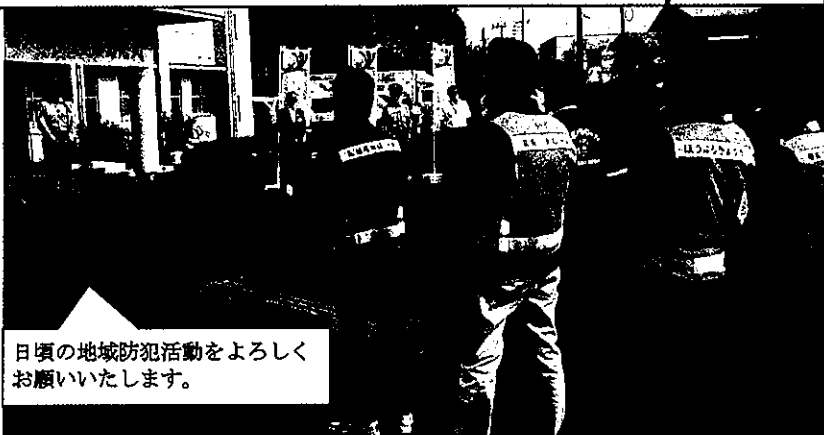
日頃の地域防犯活動をよろしく お願いいたします。

10月11日、令和6年全国地域安全運動出発式を志布志警察署駐車場で実施しました。署員や地域安全モニター、少年ボランティア、青パト隊等総勢70人が参加した会場では、防犯功労賞の表彰伝達のあと、志布志警察署長が「うそ電話詐欺やSNS型投資・ロマンス詐欺が急増しており、関係機関やボランティアの方々と連携し、全力で各種活動に取り組む」とあいさつ。