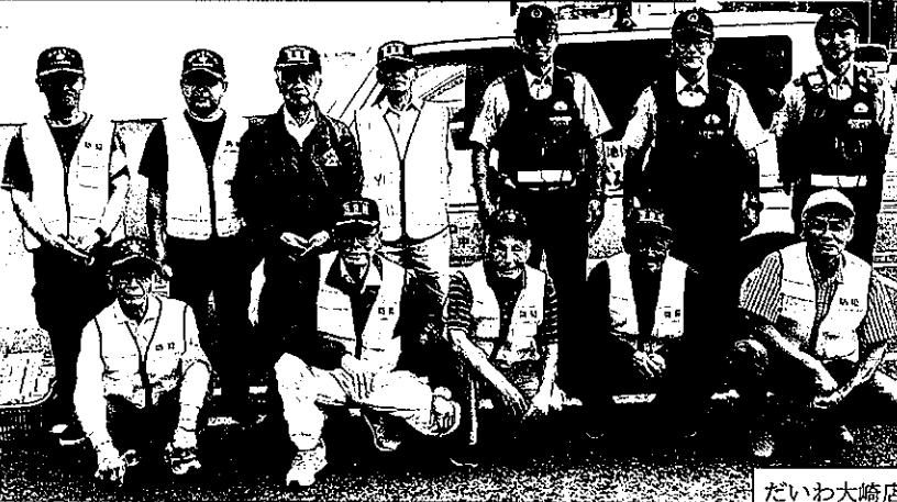
サンキュー西志布志店、ニシムタ志布志店のキャンペーン参加者

地域安全モニターや青パト隊の皆さんが出発式後、サンキュー西志布志店、ニシムタ志布志店、だいわ大崎店で防犯キャンペーンを実施しました。