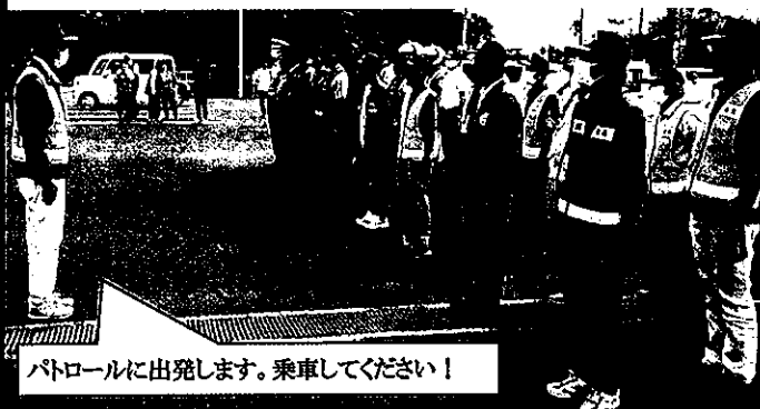
パトロールに出発します。乗車してください！