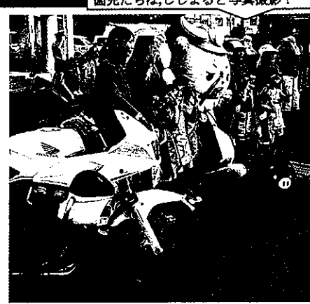
園児たちはししまると写真撮影！