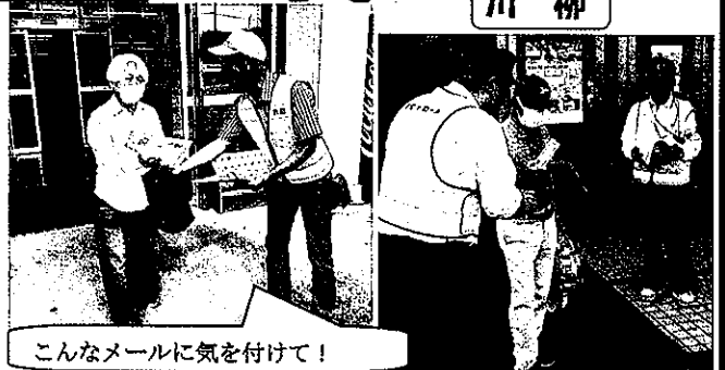
こんなメールに気を付けて！