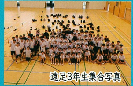
遠足3年生集合写真

さて、新生徒会の皆さんは、どんな活躍を見せてくれることでしょう。志布志高校の未来を形づくるために、新しいアイデアをどんどん出して、和気藹々と実行して行ってほしいと思います。そして、生徒会を中心に、生徒のみなさん一人ひとりの協力のもと、志布志高校の新しい伝統を創造してください！