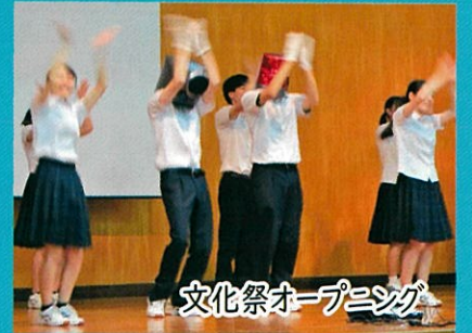
文化祭オープニング