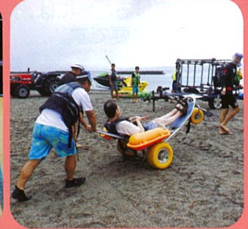
障がい児者チャレンジ事業