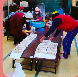
高齢者宅へのお弁当配布