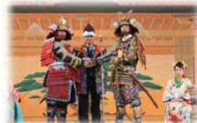
大隅の國 やっちく松山藩秋の陣まつり