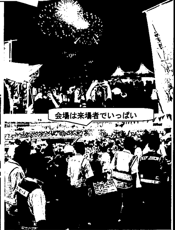
会場は来場者でいっぱい