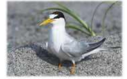
▲絶滅危惧種 コアジサシ