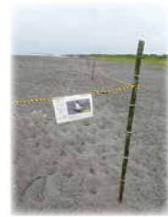
▲竹とロープで囲む