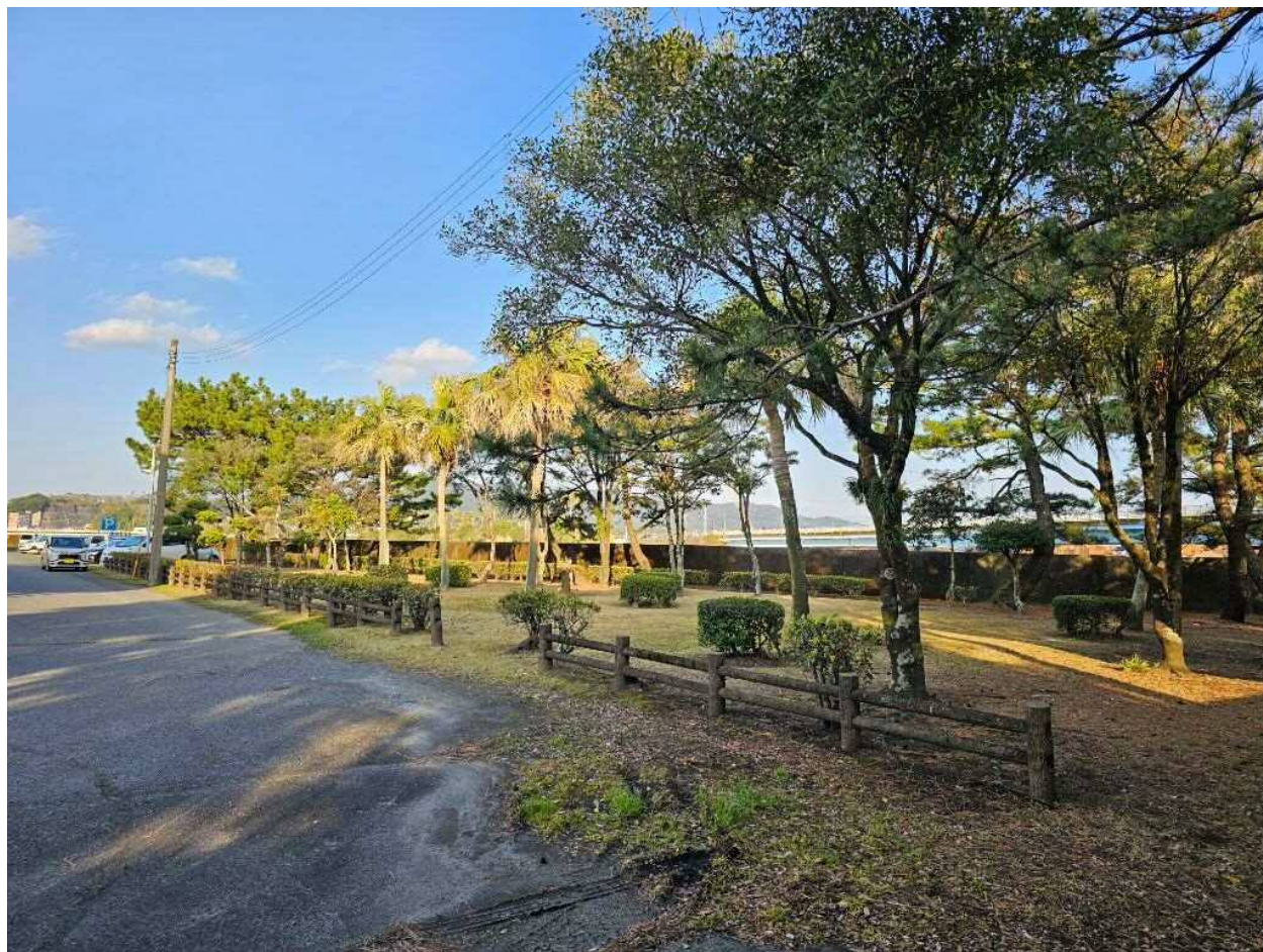
現地写真（令和6年3月撮影）