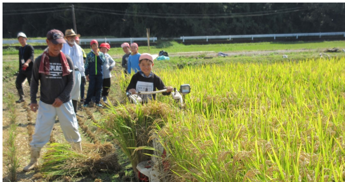
バインダーで稲を刈る児童