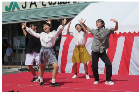
志布志高校ダンス部の演技