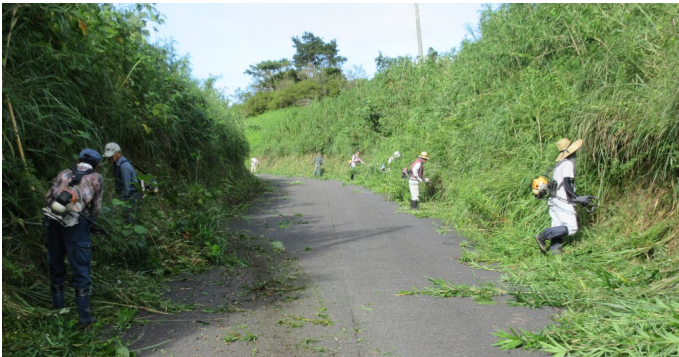
市道の草刈りをする各集落の参加者ら