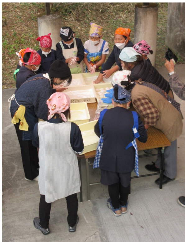
もちを丸める児童ら