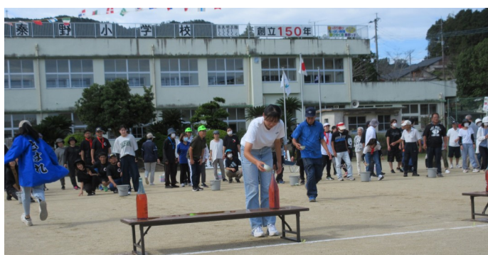
献血リレーで集落優勝を争うなのはな団地