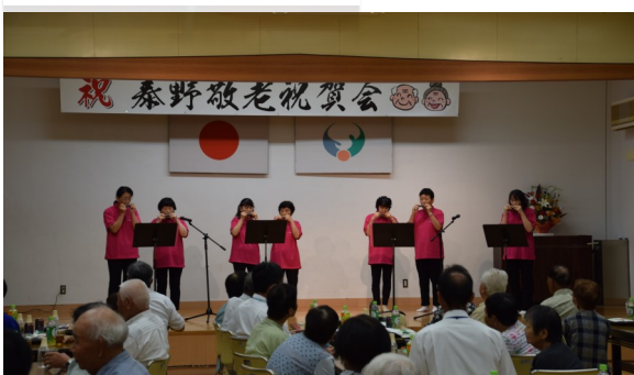
ハーモニカ演奏を披露するJA女性部