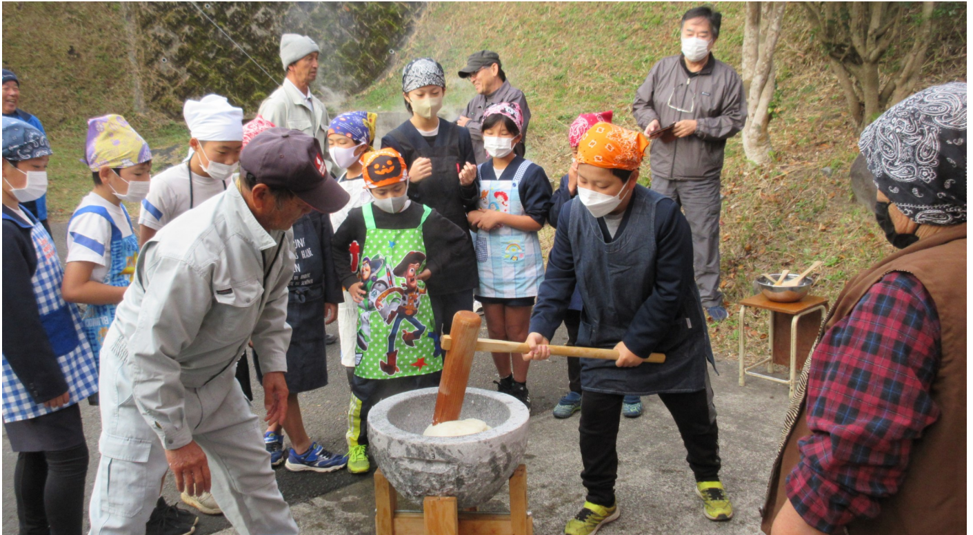
杵でもちをつく児童