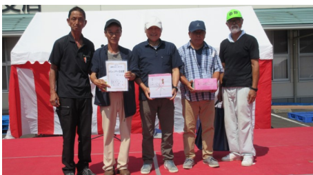
かかしコンテストでコミュニティ会長賞の尾野見のみなさん