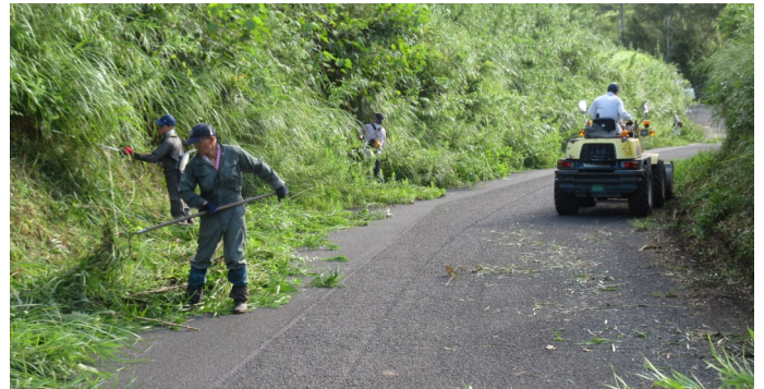
市道の草刈り・収集をする各集落の参加者ら