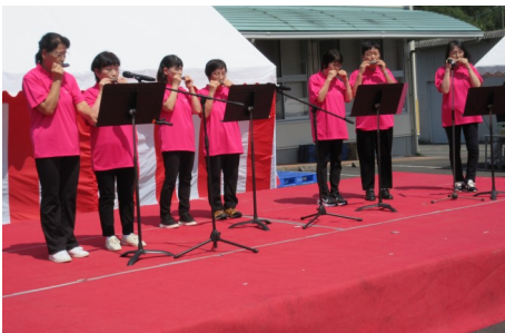
JA女性部のハーモニカ演奏