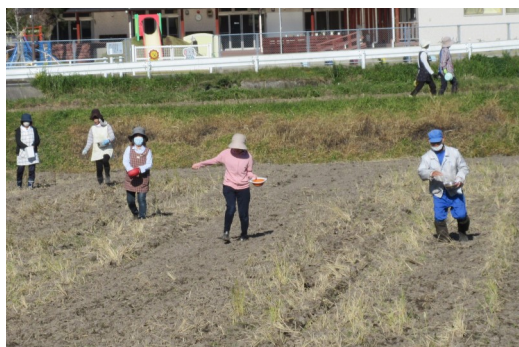
レンゲの種をまく参加者ら

地域の景観をよくする活動として、レンゲの種まきを10月28日、みどり保育園前から農協松山支店前の水田で、校区民約60人が参加して行いました。