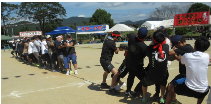
綱を引き合う2分団(左)と3分団の選手ら