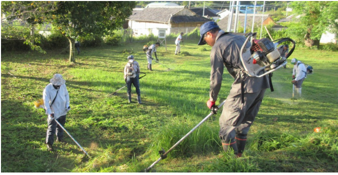
校庭の草刈りをする各集落の参加者ら