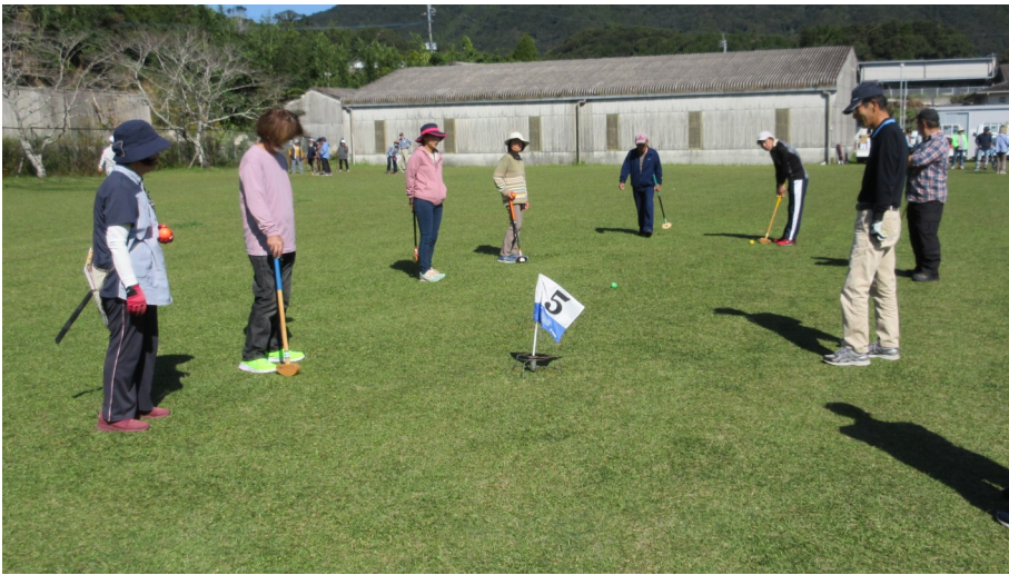
優勝した川西チームとラウンドする畑村釘Bチーム

第2回グラウンドゴルフ大会が10月22日、泰野地区公民館広場で12チーム61人が参加して行われました。校区民の交流と連帯感を深め、健全で明るい地域社会を作ると共に健康の増進を図ることを目的に、7月に続いて健康福祉部の事業として行われました。また、今年は、泰野の事業所からあけぼの園職員チームが参加しました。競技は、団体戦と個人戦が行われ、和気あいあいななか、歓声が上がっていました。競技終了後、閉会式に移り、成績発表と表彰式が行われました。