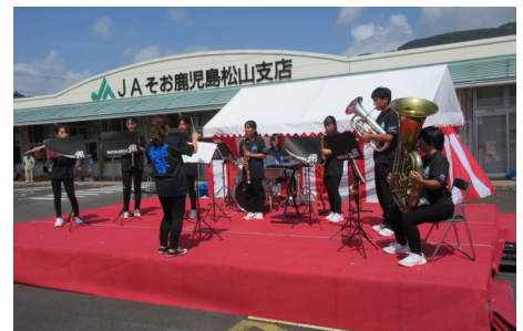
松山中吹奏楽部の演奏