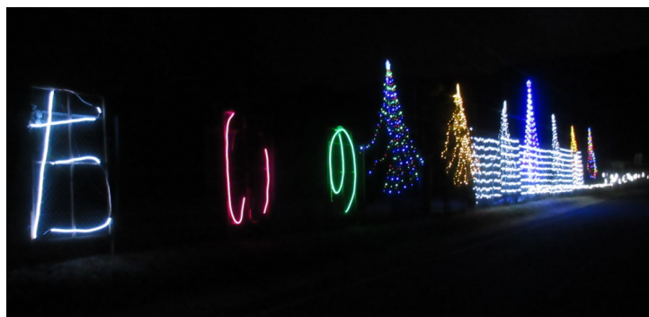
コミュニティ広場のイルミネーション

長のあいさつの後、参加者みんなで一斉に声を揃えてカウントダウンを行い、約2万球のイルミネーションに灯がともりました。今年もみどり保育園と公民館広場に設置しました。公民館広場には、イルミネーションを増設しました。今年度の1月6日の鬼火焚きの日まで、午後5時30分から午後10時まで毎日点灯しました。