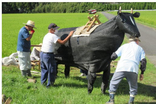
尾野見から参加した牛のかかし

水土里サークルでのもんそ会が地域の景観をよくする活動として行っていますが、泰野校区コミュニティ協議会と協働の事業と