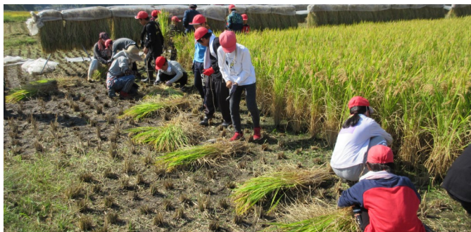
鎌で稲を刈る児童ら

コミュニティ会員や農家の方々に教えてもらいながら稲刈りをしていました。またバインダーを使った稲刈りも体験しました。