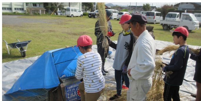
足踏式脱穀機で脱穀する児童ら

児童らは、「昔の道具は難しかった」、「昔の人はすごいなと思った」と感想を述べていました。