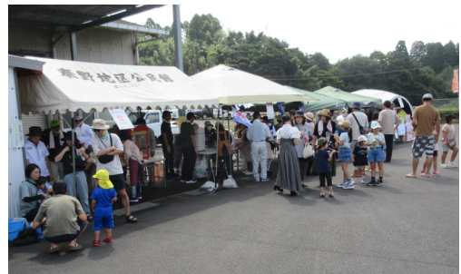
来場者で賑わう各店舗

出演し、まつりを盛り上げていました。かき氷、ポップコーン、綿菓子、飲み物、キッチンカー等の出店がありました。