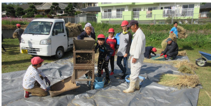
唐箕で粃と藁くずなどを選別する児童ら