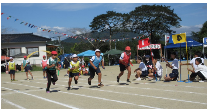
紅白対抗リレーのスタート