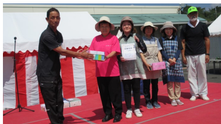
かかしコンテストで最優秀賞の泰野女性部のみなさん