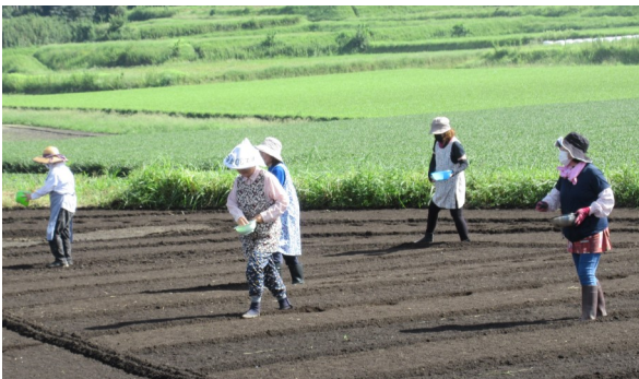
コスモスの種まきをする参加者ら