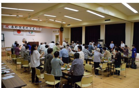
祝賀会の開宴風景