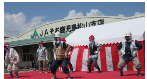
内之野さわやかグループの踊り