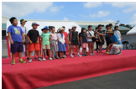
泰野小学校の合唱