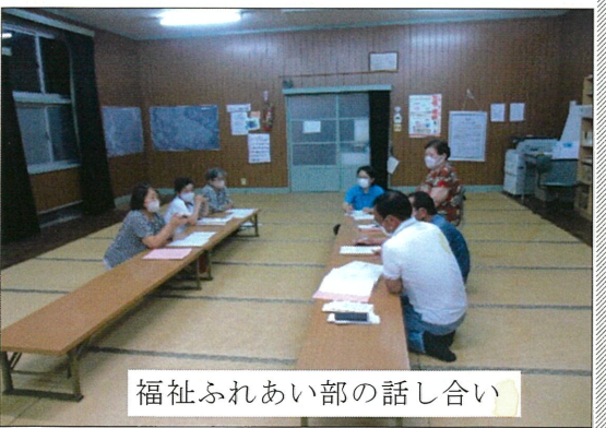
福祉ふれあい部の話し合い