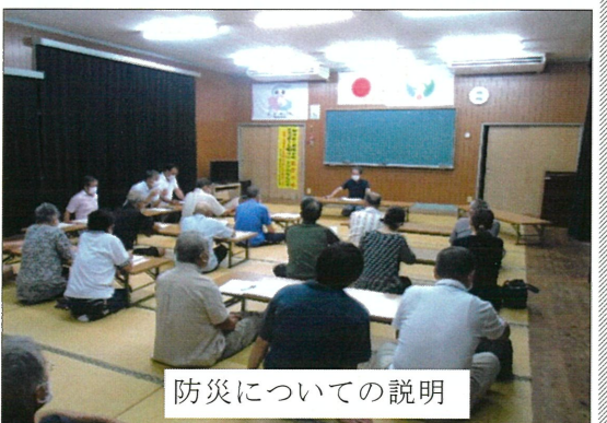
防災についての説明