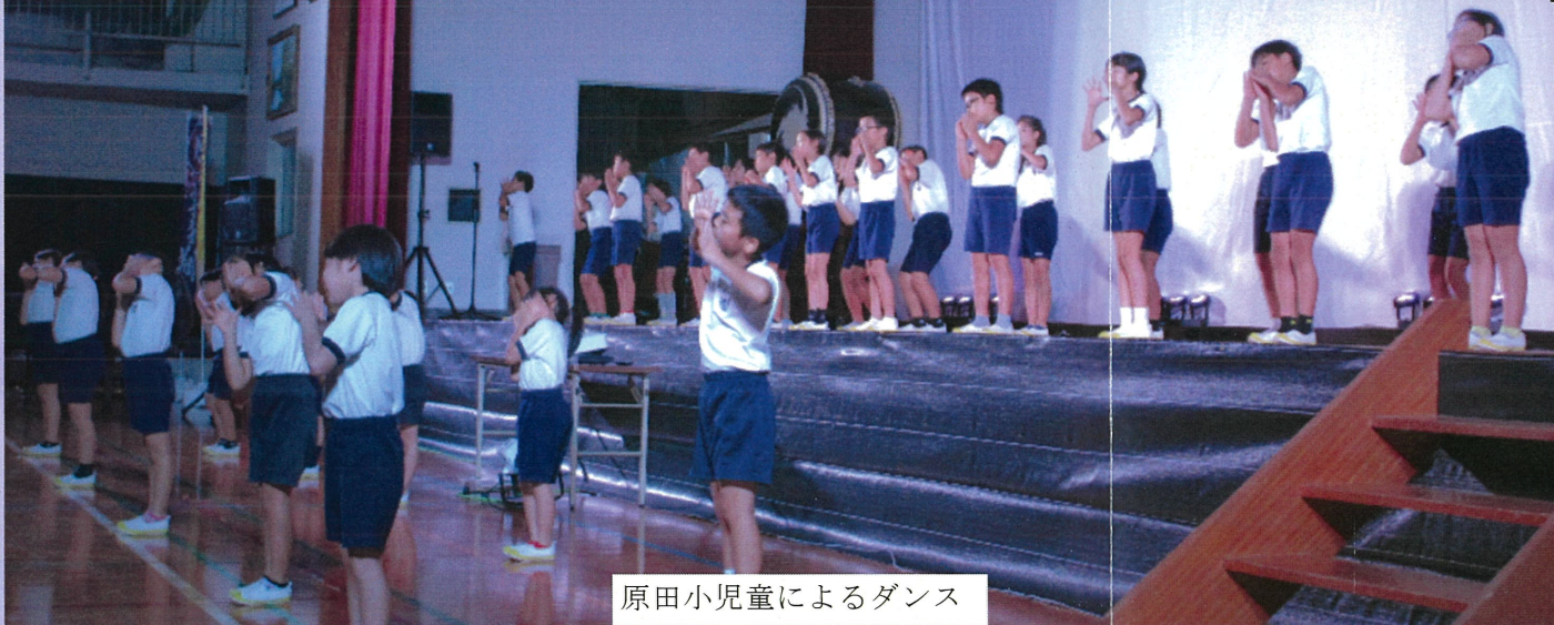
原田小児童によるダンス