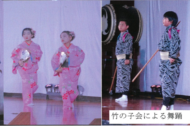
竹の子会による舞踊