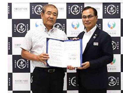
市と協議会のパートナーシップ協定締結式(R4年7月)

さて、我が母校の森山小学校は令和5年度に創立150周年を迎えます。森山小らしい温もりのある式典をめざし、各部ごとに着々と準備が進んでいるところです。森山校区の皆様方におかれましても、引き続き、御理解と御支援をよろしくお願い申し上げます。