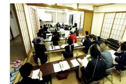
定例総会の様子(R5年3月)

祝 創立150周年 あいさついっぱい 花いっぱい やるきみなぎる 森山小 志布志市立 森山小学校 令和5年 森山小PTA