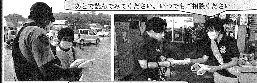
あとで読んでみてください。いつでもご相談ください！