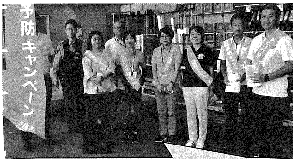
志布志保健所、志布志市保健課、警察署の参加者の皆さん！

鹿児島県内では毎年約300人の方々の尊い命が自殺により失われている状況にあります。自殺未遂者は自殺者数の約10倍以上とされています。こころの健康相談窓口は、志布志市保健課・大崎町保健福祉課、志布志保健所(472-1021)、鹿児島いのちの電話(099-250-7000)、心の電話(099-228-9566)、自殺予防情報センター(099-228-9558)などです。一人で悩まず、どうぞご相談ください。