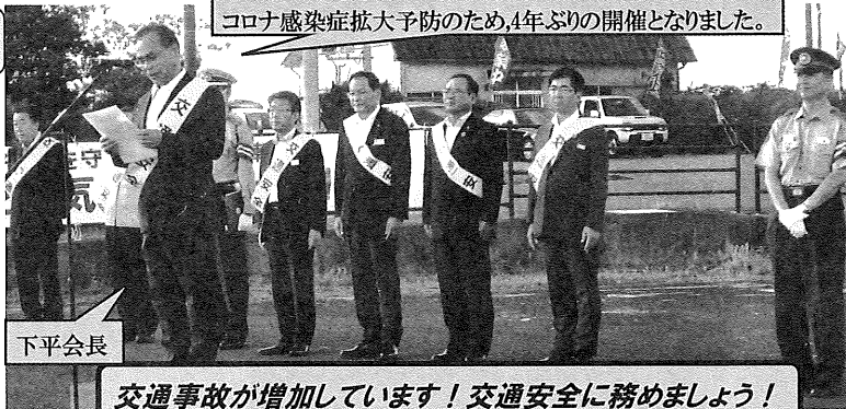
コロナ感染症拡大予防のため、4年ぶりの開催となりました。