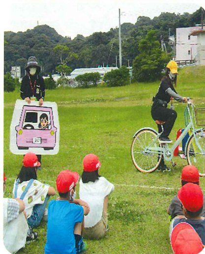
薩摩川内市立長浜小学校