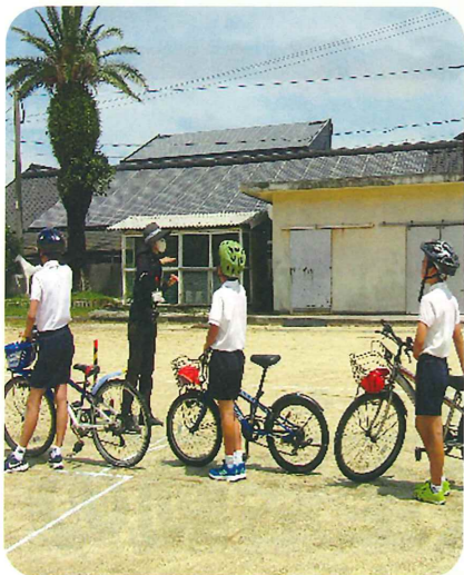
薩摩川内市立里小学校