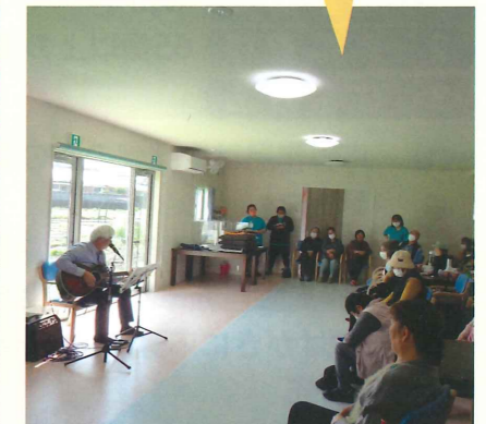
事務局長による弾き語り交通安全講話 肝付地区協会