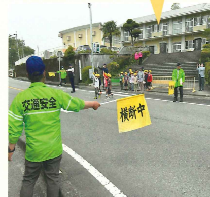
小学生に対する交通安全教室 曾於地区協会