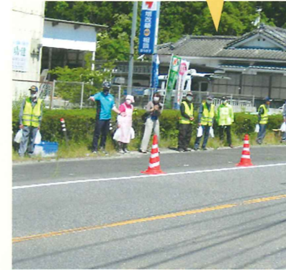
交通安全キャンペーン 横川地区協会