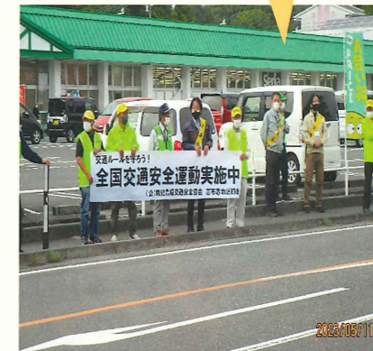
交通安全キャンペーン 志布志地区協会