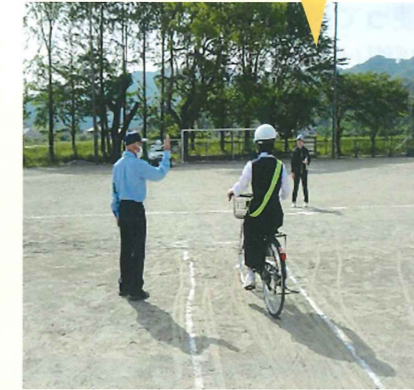
自転車の通学生への交通安全教室 霧島地区協会