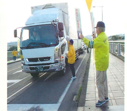
交通安全キャンペーン 霧島地区協会