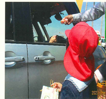
保育園児による交通安全キャンペーン 垂水地区協会