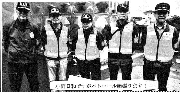
関屋口交番管内地域安全モニターの皆さん