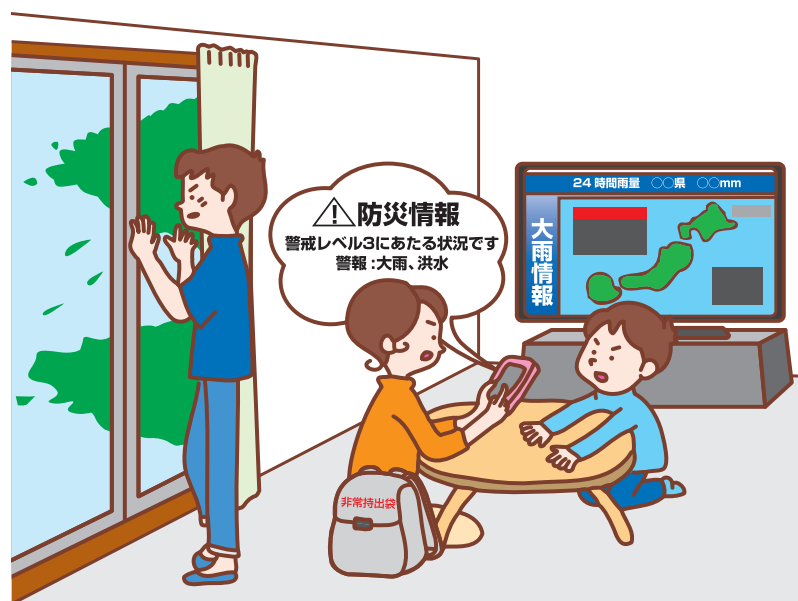
(ページ内の図表は内閣府・気象庁ホームページより抜粋、編集)

警戒レベル3 高齢者等避難 や 警戒レベル4 避難指示 で、地域の皆さんで声をかけあって、安全・確実に避難しましょう。