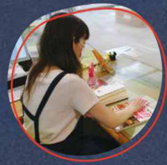
より安全に本を借りられるよう 書籍消毒器を近日設置予定！