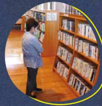
志布志市立図書館(本館) (平成9年度～令和元年度)