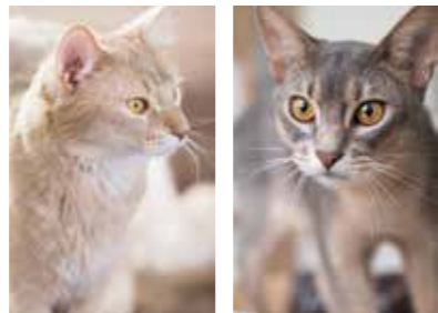
写真② 愛猫のいなり(左)とうなぎ(右)。ソマリとアビシニアンという猫種。