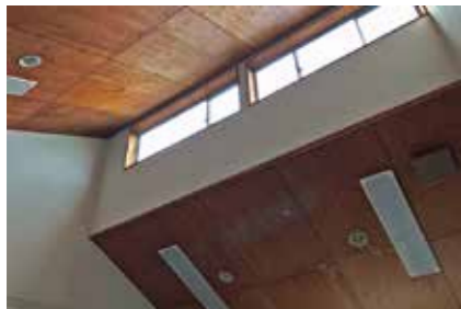
写真③ 自宅リビングの天井。高さが5mほどあり、エアコンの電気代が心配…