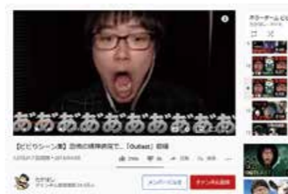
写真① ユーチューブではホラーゲームの実況動画に定評(?)あり。

市民の皆様には取材などでお世話になることがあるかと思っています。その際にはぜひ様々なお話しをさせてください。また、インターネットを主軸とした情報発信についての相談などがありましたら、ぜひ気軽に声がけいただけます。それでは、3年間よろしくお願ひします!