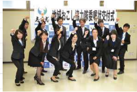
地域おこし協力隊のみなさん

■問い合わせ先：企画政策課 地域政策係 TEL：474-1111（内線 257）