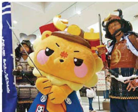
ししまると共にやっちく松山藩をPRする橋口隊員