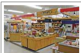
商品はアビアの港湾通りで買えます