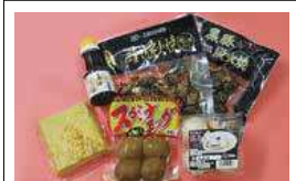
卵を使った商品も取り扱っています