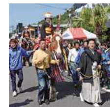
「シャンシャン馬 ～お釈迦まつり～」