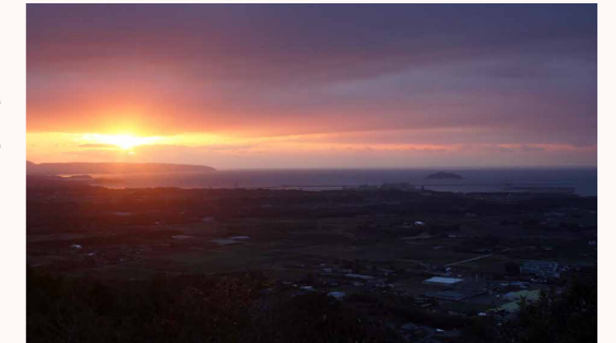
(写真) 岳野山から見える朝日

早朝や夕方に見せるいつもと違った風景、四季折々の風景。そんな地元の人だからこそ知っている美しい風景が見られる「場所」「時間」「季節」の情報を、企画政策課ブランド推進室までお寄せください。