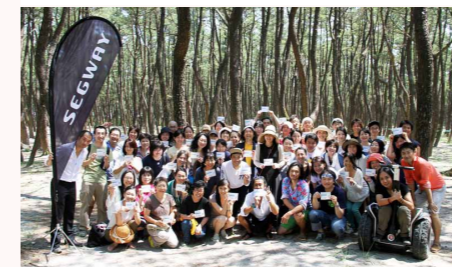
首都圏からたくさんの方々有志布志に

こころざし経営よろず相談室を企画政策課ブランド推進室と共同運営している株式会社ふじやま学校では、志布志市の地域ブランディングから、コンサルティング、文化事業、講演会運営を、鹿児島から首都圏にかけて広く展開。今年の夏、首都圏開催のビジネスセミナーをお休みして、大隅半島体験ツアー「HOME」を企画、開催し、関東圏を中心に、延べ100人近くの方がふじやま学校のビジネスセミナー受講を目的として、大隅半島に足を運んでいただきました。